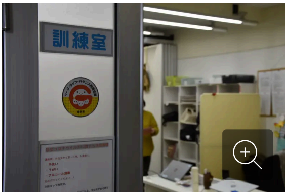
日本財団のモデル事業の一環で、障害の有無を問わずに利用者を受け入れている就労移行支援事業所＝岐阜市内で2026年2月13日

毎日新聞 | 2026/4/22 11:00 (最終更新 4/22 11:00) 943文字